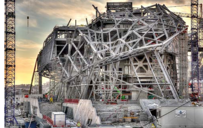
Musée de la confluence