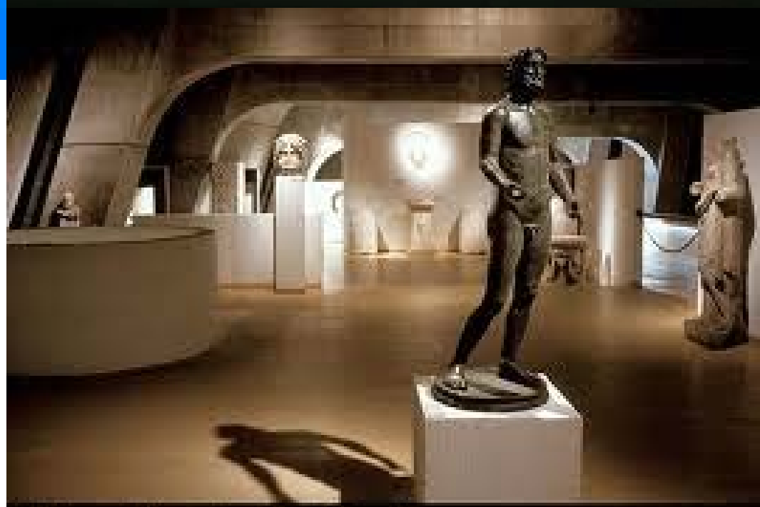
Salle de Népos

Founded -43 Capital -27 / +69 German raids Capital Trier 297 End of Roman empire 476